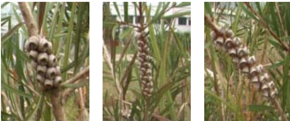
Fig. 1. Callistemon citrinus capsules