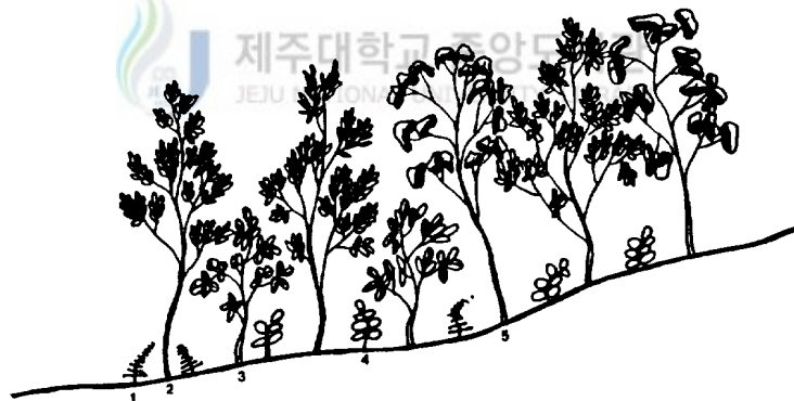
Fig. 6. Vegetation profile of Orixa japonica community 1, Rumohra standishii 4, Sanicula chinensis 2, Styrax japonica 5, Lindera erythrocarpa 3, Orixa japonica

이 群落의 識別種으로는 상산( O. japonica ), 일색고사리( Rumohra standishii ), 한라돌쩌귀( Aconitum napiforme ), 쪽동백나무( Styrax obassia ), 고추나무( Staphylea bumalda ), 박쥐나무( Alangium platanifolium var. macrophyllum ) 등이 出現한다(Fig. 6).