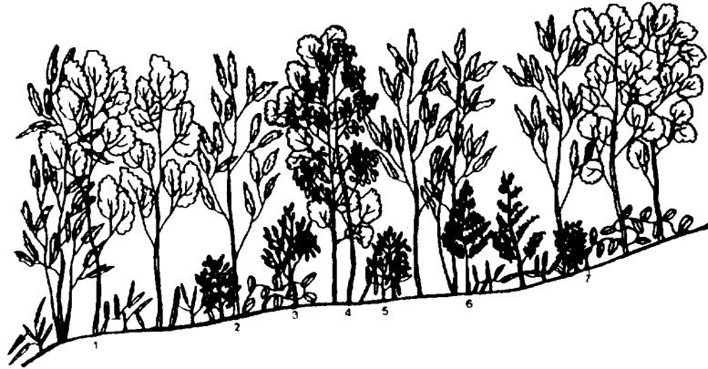
Fig. 8. Vegetation profile of Taxus cuspidata subcommunity 1, Carpinus laxiflora 5, Sasa quelpaertensis 2, Quercus serrata 6, Taxus cuspidata 3, Ilex crenata 7, Schizandra nigra

아그베나무( Malus sieboldii ), 흑오미자( Schizandra nigra ), 까치박달( Carpinus cordata ) 등 이다(Table 2). 分布地域으로는 標高 550 - 1,100m사이인 동수악, 서귀포시 고근산, 거린사슴, 1,100고지, 성판악 등 大部分의 地域에 分布한다(Fig. 8).