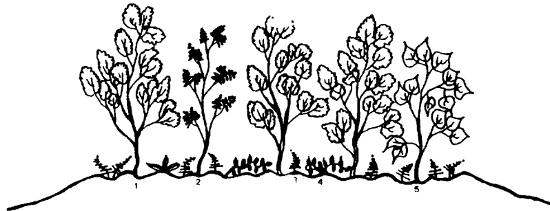
Fig. 5. Vegetation profile of Polystichum lepidocaulon community 1, Celtis sinensis 2, Sapindus mukorossi 3, Polystichum lepidocaulon 4, Hedera rhombica 5, Mallotus japonicus

(B) 더부살이고사리群落( Polystichum lepidocaulon community) 이 群落의 識別種은 더부살이고사리( P. lepidocaulon ), 무환자나무( Sapindus mukorossi ), 황새냉이( Cardamine flexuosa ), 검양웃나무( Rhus succedanea ), 까마귀밥(여름)나무( Ribes fasciculatum var. chinense ), 말뚝비름( Secum bulbiferum ) 등이었다. 分布地域으로는 標高 150-350m사이의 北濟州郡 한경면 저지리, 南濟州郡 안덕면 상창리, 화순리 등에 分布하고 있었다. 地形은 凸形이며 土壤濕度가 높은 岩石地이고(Fig. 5), 群落 上層部인 亞喬木層에는