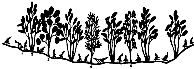
Fig. 4. Vegetation profile of Quercus gilva subcommunity 1, Rumohra aristata 4, Quercus gilva 2, Quercus glauca 5, Cinnamomum camphora 3, Viburnum awabuki

산유자나무亞群落과의 區分種으로는 녹나무( C. camphora ), 아왜나무( Viburnum awabuki ), 개가시나무( Q. gilva )이며, 특히 이 곳에는 濟州島의 他地域에서는 거의 볼 수 없는 개가시나무( Q. gilva )가 亞群落을 이루고 있으며 分布地域으로는 標高 150-200m사이의 北濟州郡 翰京面 저지리 평화동, 명의동 附近의 牧場地帶에 帶狀으로 分布하고 있다. 이 亞群落의 形成은 火入에 의한 被害가 비교적 적은 凹地形의 熔岩流 지역에 주로 形成되어 있다 (Fig. 4).