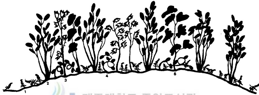
제주대학교 중앙도서관 Fig. 3. Vegetation profile of Xylosma congestum subcommunity 1, Rumohra aristata 4, Ficus nipponica . 2, Quercus glauca 5, Distylium racemosum 3, Xylosma congestum

개가시나무亞群落到에 대한 區分種은 산유자나무( X. congestum ), 조록나무 ( Distylium racemosum ), 모람( Ficus nipponica ) 등이었고 上層部位에 종가 시나무( Q. glauca )가 優占하고 있으며 팽나무( C. sinensis ), 예덕나무( M. japonicus )의 被도와 群도가 낮게 나타났다(Fig. 3).