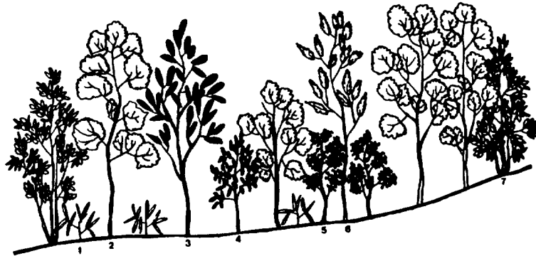
Fig. 7. Vegetation profile of Quercus acuta subcommunity

이 亞群落의 區分種은 暖帶性 樹種인 황칠나무( Dendropanax nobifera ), 붉가시나무( Quercus acuta ), 사스레피나무( Eurya japonica ) 등 이다(Table 2). 分布地域은 標高 550 - 650m사이의 南濟州郡 남원읍 수악교와 논고교 등의 周邊에 分布한다(Fig. 7).