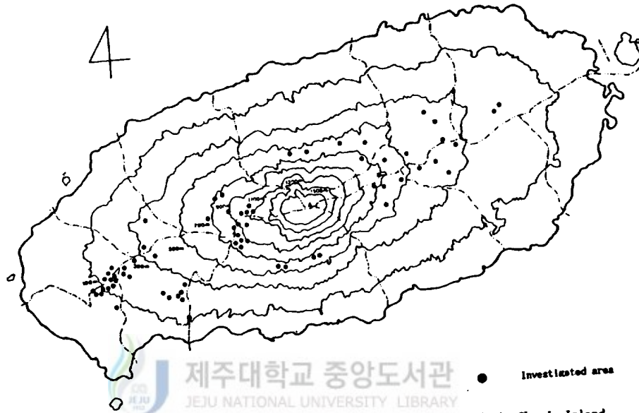
Fig. 1. Locations map showed investigation area for this study in Che-Ju Island.

調査地域은 山林廳 林業研究所에서 作成된(1980) 林相圖(1:25,000)에서 闊葉樹林地域을 單位面積 1Ha 以上の 林分을 抽出하고 現地踏査에 의해 확인된 二次林을 調査 對象地로 선정 하였다(Fig. 1).