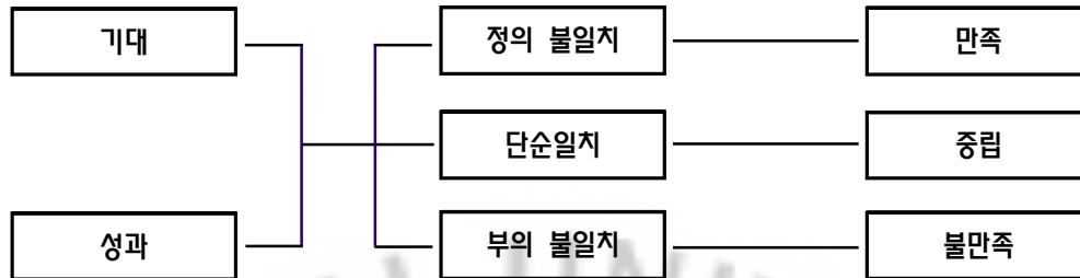
<그림 2-1> 기대 일치/불일치 과정

출처: Erevellers, S., & Lcavitt, C.(1992). A Comparison of Current Models of Consumer Satisfaction/Dissatisfaction. Journal of Consumer Satisfaction, Dissatisfaction & Complaining Behavior , 5, p.105. 89) 이를 참고로 연구자 재구성.