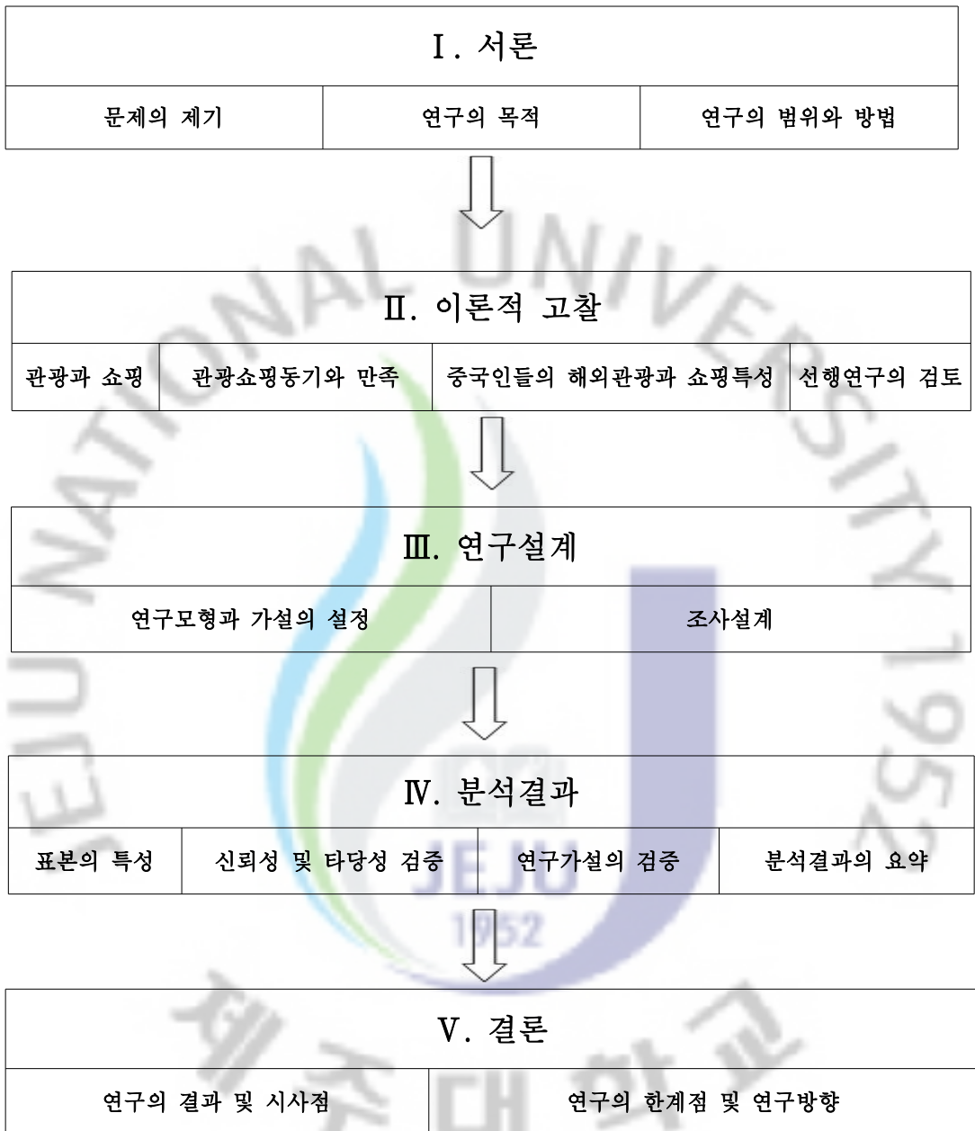
<그림 1-1> 연구의 흐름도