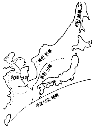
(그림 1 쿠로시오해류도)

이러한 북태평양의 환류체계에서 볼 때, 동아시아 해역에서 쿠로시오 해류가 미치는 해역은 한정적이고 영향을 받는 범위가 좁다. 쿠로시오 해류가 영향을 미치는 해역은 인도네시아, 말레이시아, 필리핀, 베트남, 중국 강남지역과 대만, 오키나와 및 일본열도, 한반도라고 할 수 있다. 한반도 해역에 들어온 쿠로시오 지류는 제주도 남쪽 해역에서 남동쪽으로 흘러 쓰시마 해협을 통과하면서 동해로