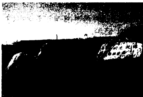
〈그림 4 보타산 노파가 만든 부두 단고적〉

곳에 밧줄을 댔다. 조류가 물러나자 사람들은 총망히 해안에 올랐다. 오직 올케만 배를 끌어안고 머리를 숙인 채 배속에서 꼼짝도 안하고 있었다. 언니는 급해서 그녀에게 빨리 가자고 재촉했다. 아가씨는 얼