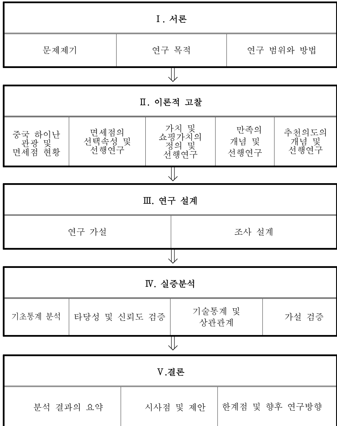
<그림 1> 연구의 흐름

제5장은 결론으로, 본 연구에 연구 결과를 요약하고 연구의 시사점과 한계점을 통해 나타난 문제점에 관해 향후 연구 방향을 서술하였다.