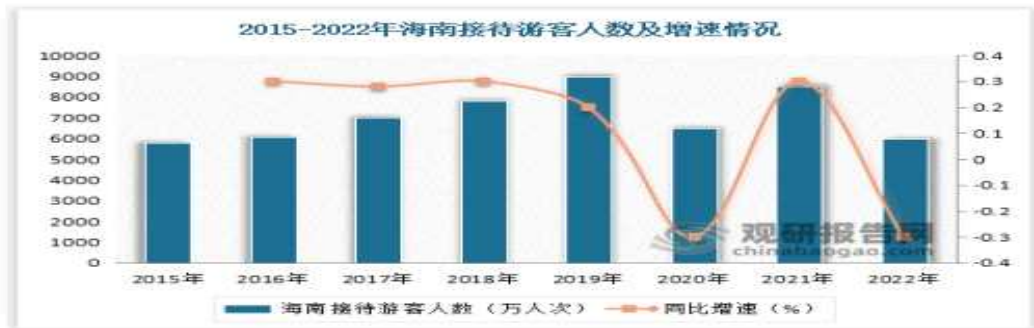
<표2-1 > 2015~2022년 하이난 면세점 관광객 수