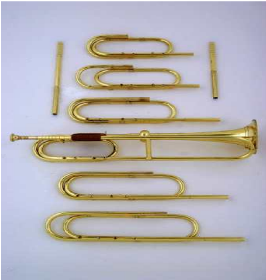
<그림 4> 내추럴 트럼펫

바로크 시대로 들어와서부터 트럼펫은 음악적 용도로 쓰이게 되었다. 내추럴 트럼펫(Natural Trumpet)이라 불렸으며 밸브(Valve)가 없고 길이가 길어 U자 형태나 S자 형태의 모양을 지녔다. 이 시대에는 높은 음역을 연주하는 클라리노 주법 16) 을 내추럴 트럼펫에 접목하여 연주하였다. 밸브나 키가 따로 없어 연주자는 호흡과 입술 모양 변형을 이용하여 음정을 조절하였고, 악기의 조성을 바꿔 주기 위해 탈부착식 관들을 사용하여 연주하였다. 탈부착식 관들을 크룩(Crook)이라는 이름으로 분리가 가능한 내추럴 트럼펫을 연결해 조성이 달라질 때마다 크룩을 교체하며 연주하였다.