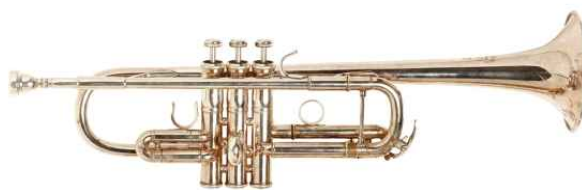
<그림 7> 피스톤 트럼펫