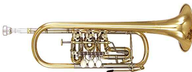
<그림 6> 로타리 트럼펫

19세기 후반부터 현재의 이르기까지 지금의 트럼펫 모양이 갖추어졌고 Bb조 트럼펫과 C조 트럼펫의 악기로 나누어져 Bb조는 소리가 크고 풍부한 음색을 뛰어나 오케스트라뿐만 아니라 미국의 재즈(Jazz) 17) 장르나 밴드(Band) 18) 에 주로 쓰이고 C조 트럼펫은 화려하고 정돈된 소리를 가지며 전통 오케스트라나 솔로 용도로 많이 사용되고 있다.