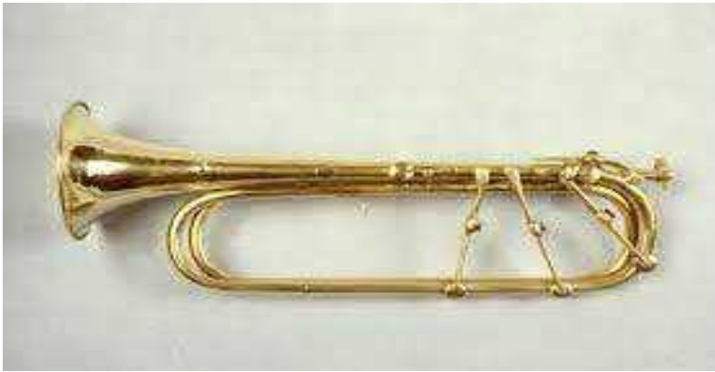
<그림 5> 키 트럼펫

고전 시대에도 내추럴 트럼펫을 사용하였으나 18세기 후반 반음계를 위한 트럼펫이 개발되었다. 트럼펫 연주자 안톤 바이딩거에 의해 만들어졌는데 반음계를 위해 E♭ 조 내추럴 트럼펫에서 6개의 키를 추가하고 배음렬만 되었던 트럼펫에서 반음 연주를 할 수 있게 되었다. 이 악기의 등장으로 하이든의 트럼펫 협주곡, 훔멜 (Johann Nepomuk Hummel, 1778-1837)의 트럼펫 협주곡 등이 작곡되었다.