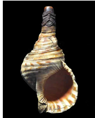
<그림 3> 콘치혼