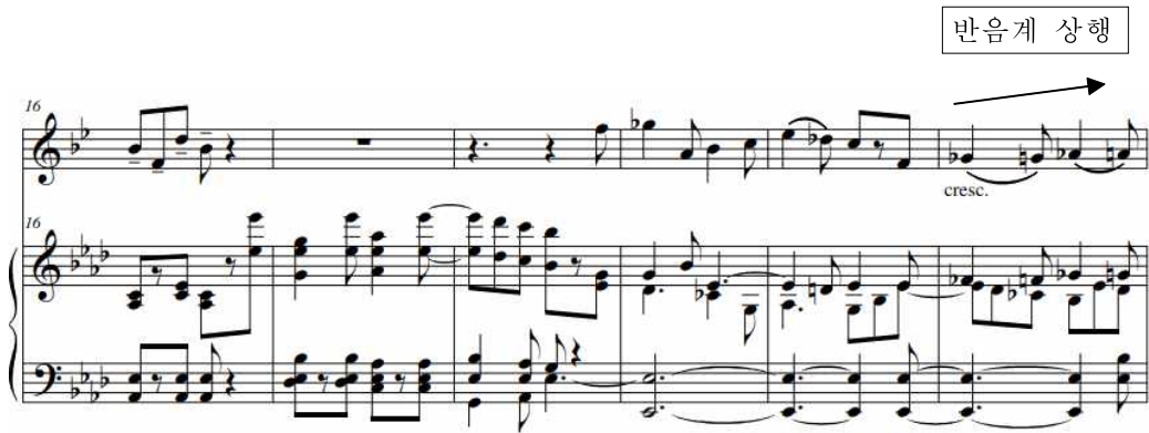
<악보 21> 16-11마디, 11마디 반음계 상행

17-18마디에서 피아노 반주가 짧은 연결구를 연주한다. 새로운 주제가 자연스럽게 이어지게 만들어준다.