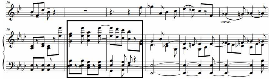
<악보 20> 16-11마디 (짧은 연결구)

17-18마디에서 피아노 반주가 짧은 연결구를 연주한다. 새로운 주제가 자연스럽게 이어지게 만들어준다.