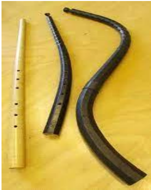
<그림 2> 징크

<그림 1> 살핑크스 나 동물 뼈가 아닌 은이나 청동으로 금속 소재의 악기로 발달하였다. 10세기 페르시아에서 전해져온 징크(Zink)와 11세기-13세기 말까지 십자군 전쟁으로 사라센(Saracen)에서 내려온 소라로 만든 콘치혼(Conch Horn)이 있다.