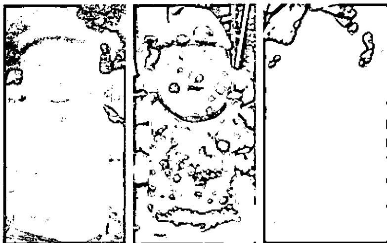
사진 7: 대정현의 돌하르방

자리하며 만물이 길러진다'고 하였다. 이런 측면에서 볼 때, 돌하르방은 제주 사람의 회로애락뿐만 아니라 그것을 통합·초월하여 '해탈'의 경지에 오른 '원형적 대부'를 상징하는 것일 수 있다.