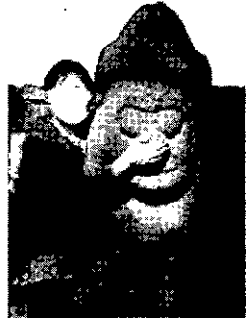
사진 6 돌하르방 코를 만지고 있는 여성의 모습

사진 속 여자는 잉태에 대한 간절한 소망을 이루기 위해 자신 안에 존재하는 돌하르방의 주술자적 특성을 불러냈던 것 같다. 사진 6에서 돌하르방은 잉태를 원하는 한 여성의 소망을 이루어줄 수 있는 ‘주술자’로서의 상징적 의미를 지니고 있다.