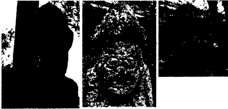
사진 5 코가 깨진 돌하르방의 모습

돌하르방의 코를 문지르거나 일부를 갈거나 잘라서 삶아 마시면 부녀자의 잉태(孕胎), 특히 아들을 잉태하는데 효험이 있다고 믿어왔다. 사진 5를 보면 돌하르방들의 코가 깨져 있다.