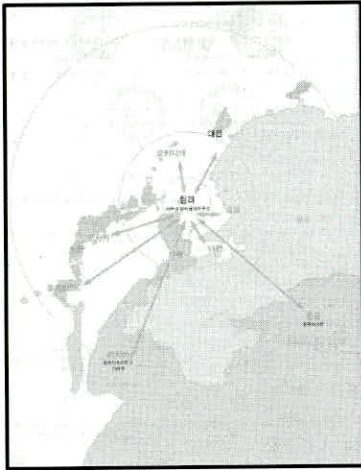
[그림 3. 동아시아지중해문화교류지도]

네트워크가 신화·굿·제주어·해녀, 말[馬]이라는 주요요소를 가진 탐라문화를 중심으로 구축될 수 있을 것이라는 점을 강조한 바 있다. 이 점을 강조하려고 동아시아지도를 거꾸로 뒤집은 이른바 「동아시아지중해문화교류지도」를 제안하였는데, 동아시아지도를 뒤집어 제주가 그 한가운데에 위치하도록 하는 이 사 고의 전환은 상당히 독창적이면서도 개방적이다. 그런데 (1)유럽문화의 출발점인 지중해를 패러디 또는 벤치마킹하였음에도 유럽문화