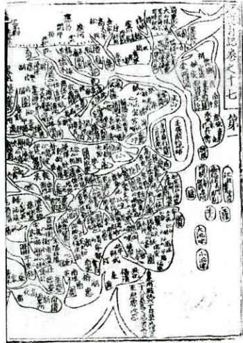
[그림 2. 『광륜강리도(廣輪疆理圖)』 日本 大倉集古館 소장]

져 있는데, 우리나라가 표시된 초기 지도의 대표적 사례로 손꼽히고 있다. 현존하는 중국 지도 가운데 제주가 최초로 표시된 것은 원나라 때 제작된 『광륜강리도(廣輪疆理圖)』이다. 이 지도는 1360년 청준(淸濬)이 제작했다고 하는데, 원본은 전하지 않고 그것을 기초로 그린 수정 목판본이 『수동일기(水東日記)』에 남아 있다. 목판본으로 제작하였기 때문에 생략된 부분이 많지만 한반도 남쪽에 제주도가 ‘탐라(耽羅)’라는 명칭으로 표시되어 있다. 원(元)나라에 이르러서야 탐라가 지도상에 등장하는 까닭은 당시에 원나라